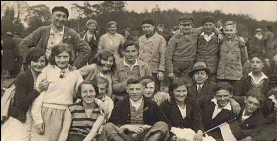
1933: Erste Götzwanderung zur Burg Landstuhl